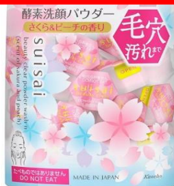
42. 酵素洗顔パウダー