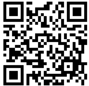
申込フォーム@初心者