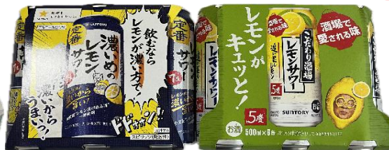
46. レモンサワー 12本