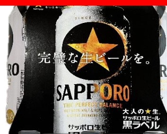
47. 黒ラベル (500mlx6本)