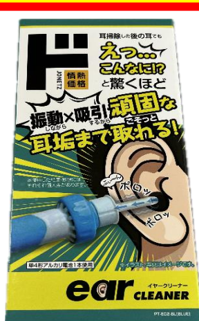
49. イヤークリーナー