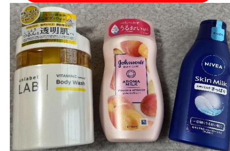
44. スキンケアセット