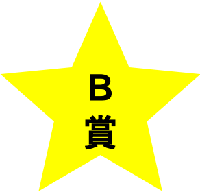
17. スチームアイロン