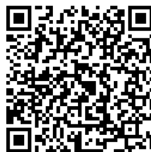
申込フォーム@初心者